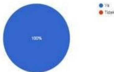
Gambar 1. Hasil dari pandangan informan terhadap keterkaitan antara Pendidikan Kewarganegaraan dan Pendidikan Karakter.

Menurut Anda, apakah pendidikan kewarganegaraan itu ada hubungannya dengan pendidikan karakter? 20 tanggapan